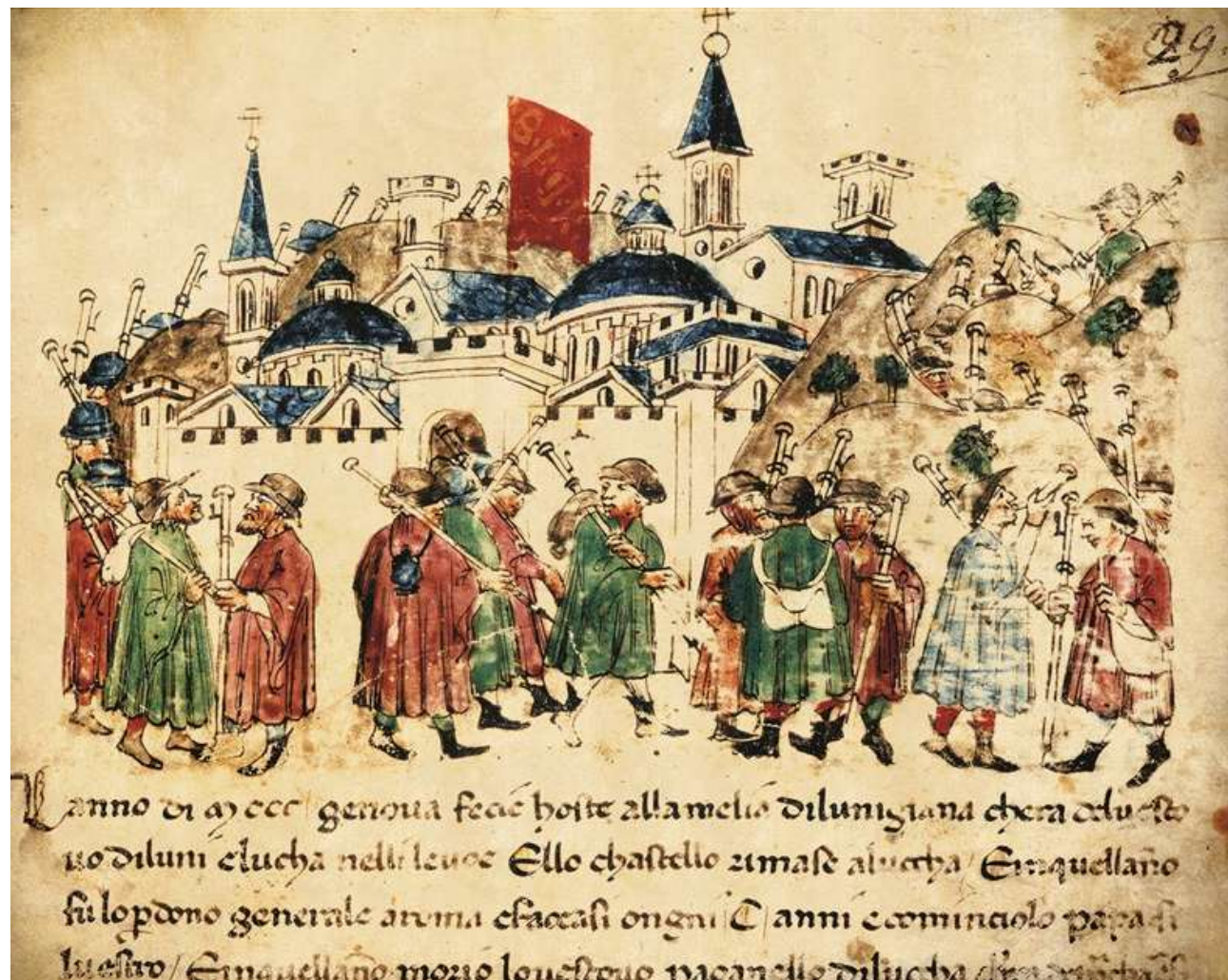
Illustrazione del manoscritto "Croniche" di Giovanni Sercambi. XIV secolo. Archivio di Stato, Lucca