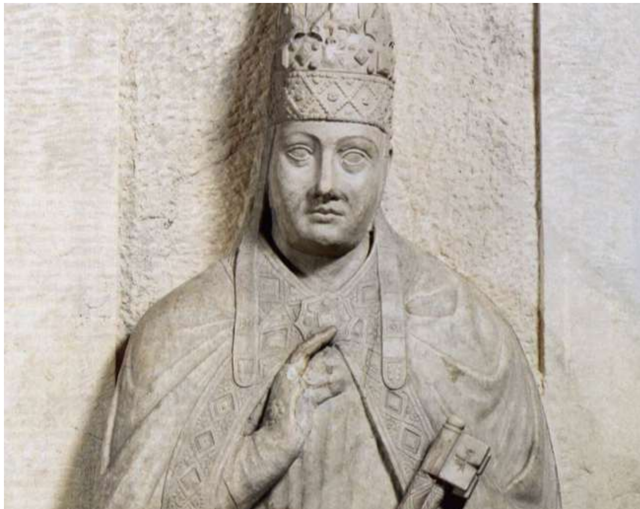
Dettaglio della tomba